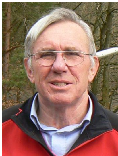
Gerhard Jordan Senioren 5